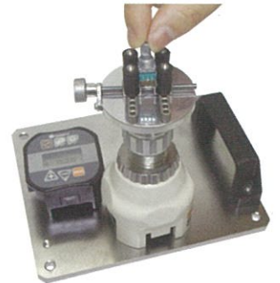
本格的な微小デジタルトルクメー タに変身 (※別売品のテーブルア タッチメントを使用)