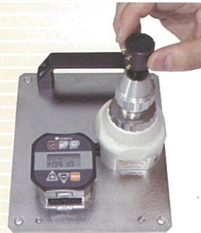
表示器を分離して、設置式の デジタルトルクゲージ (※別売品のATGE測定台を使用)