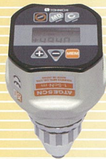
表示器一体状態で 手持ち式のデジタルトルク ゲージ